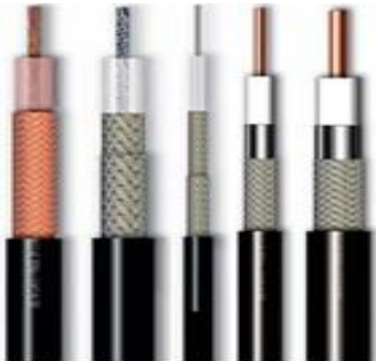
Cables LMR 100 – 195 – 200 – 240 – 400