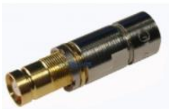
1,6/5,6 (DIN47295) IEC169-13 / CECC22240