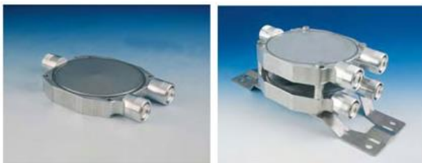
Diplexores – Stripline Diplexer